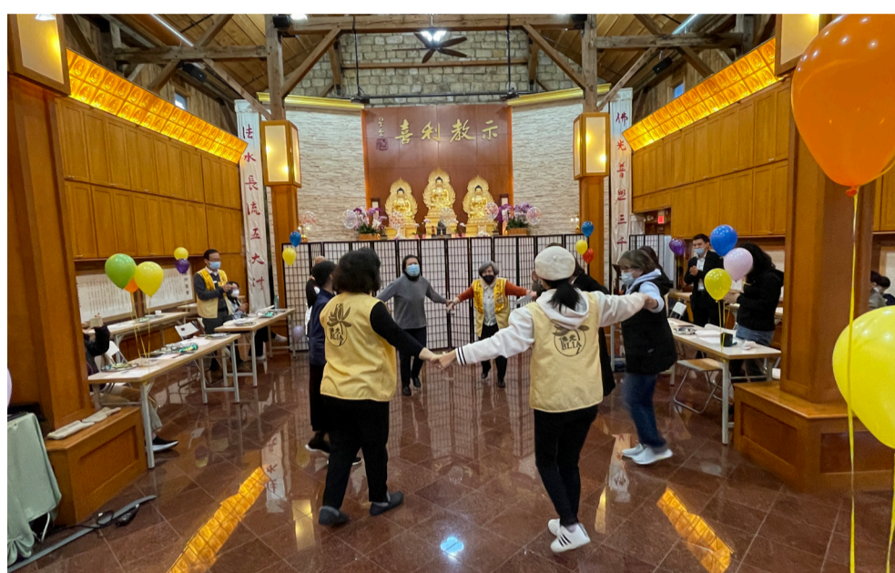
住持永嘉法師帶動大家一起合唱《四海都有佛光人》，佛光人歡唱並開樂起舞

時刻，芝加哥佛光聯誼活動，邀請各會第一分會也應節與，藉由活動，聯員們彼此交流、聯誼、關懷，如同是「一家人，相互惜福，感恩陪伴！寒冷冬季裡，