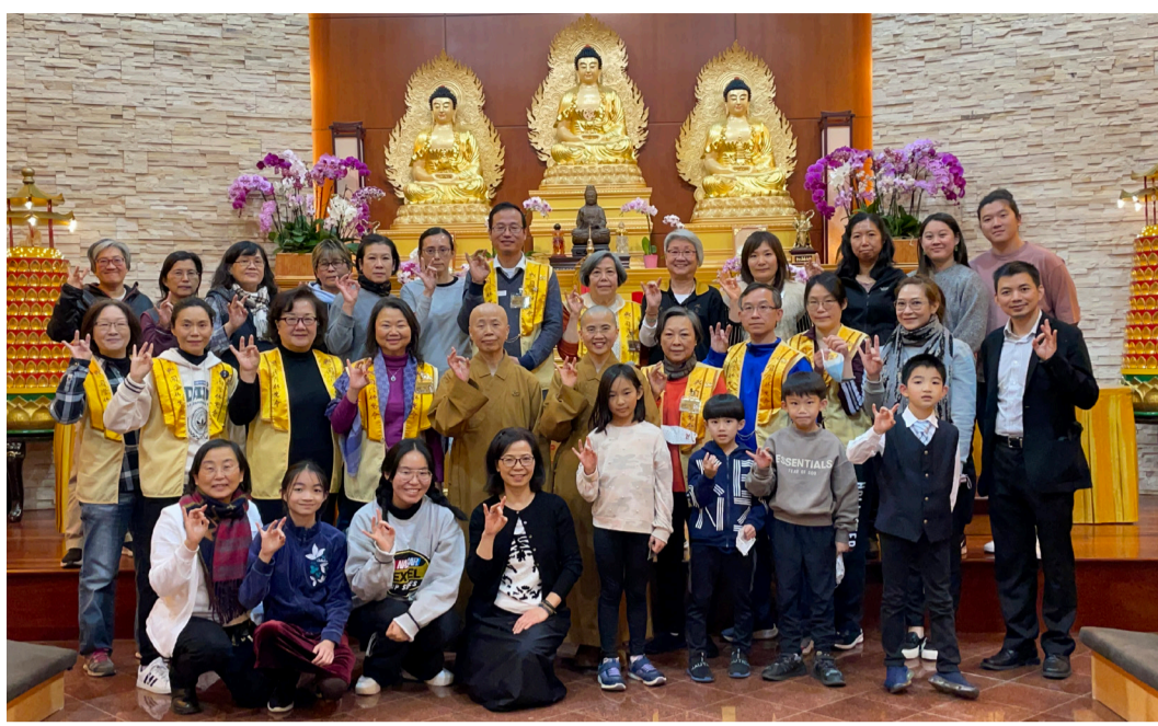
住持永嘉法師及監寺有恆法師，引導大家於佛前圓滿團體大合照