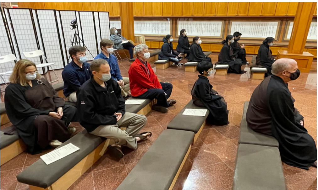
英文共修中的禪修靜坐及繞佛，皆是西方人士最喜歡的。