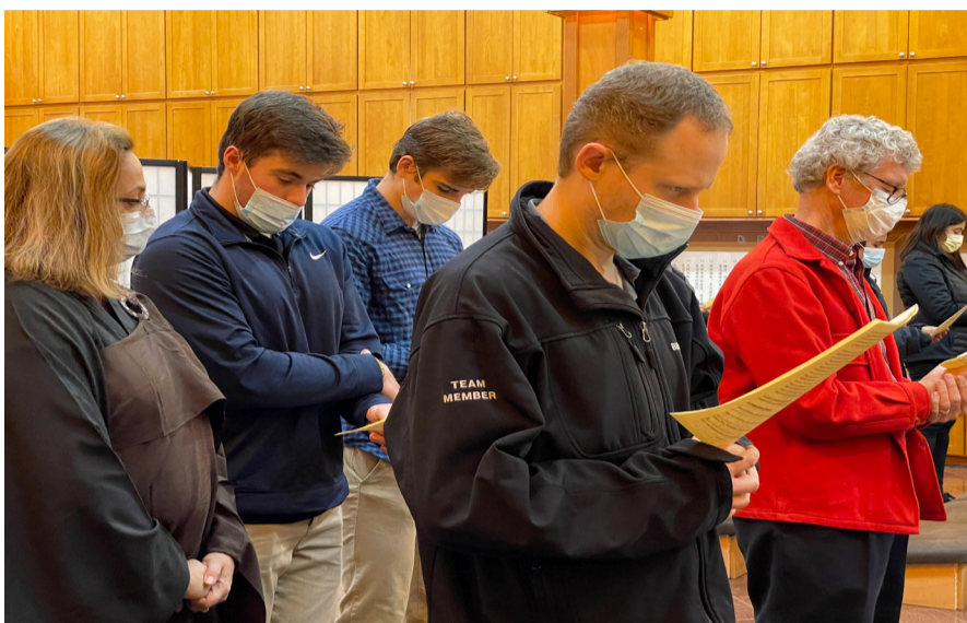
每月一次的英文共修，不斷接引英文本土信眾，加入佛光大家庭。