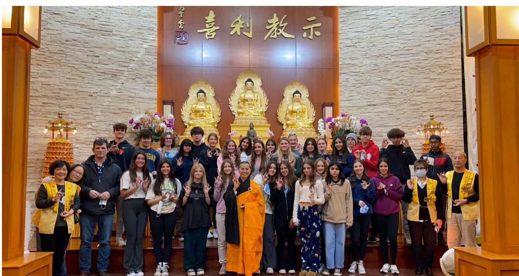
芝加哥瑞柏市高中比較宗教學的 32 位師生到芝加哥佛光山進行參訪。