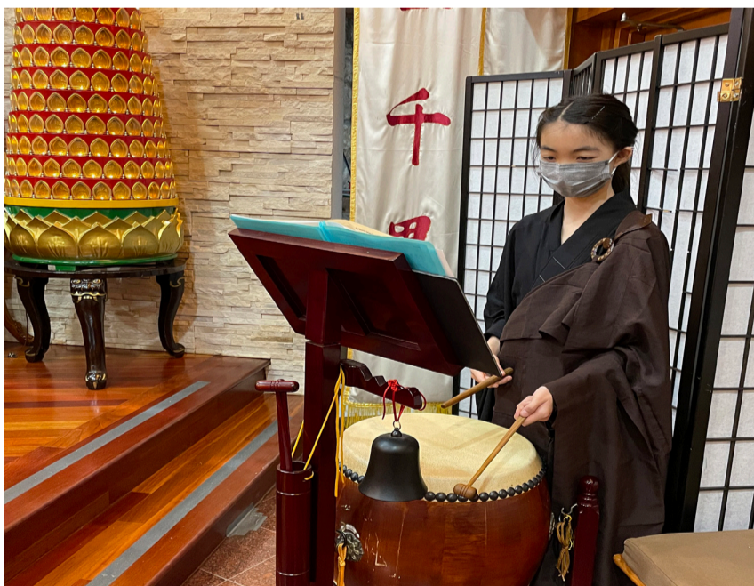
佛光青少年施打法器。