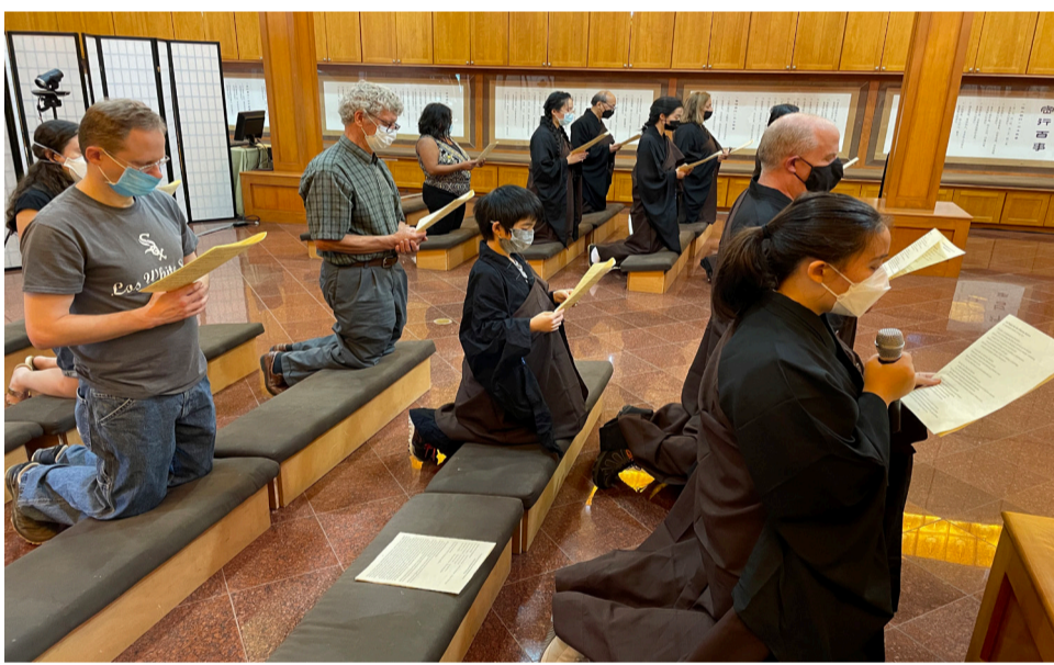
全英文的共修法會，本土信眾恭請星雲大師《共修法會祈願文》。