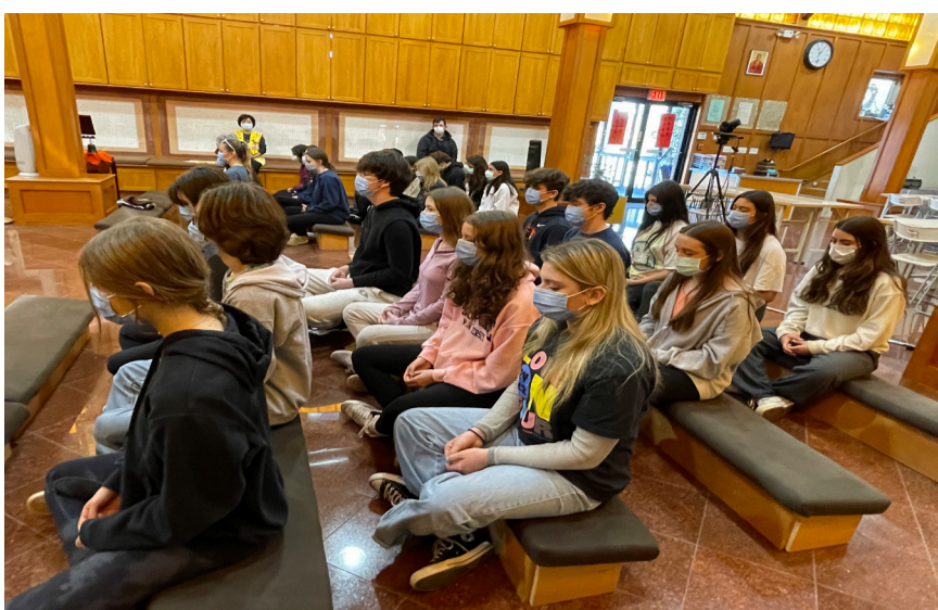
學生們非常專注認真，享受禪修帶來的內心平靜。

【本報訊】(人) 高中 (Naperville, Illinois) 比較宗教學 (Comparative Religion) 的 32 位師生到芝加哥佛光山進行參訪，特別全程參與到寺院的全英文共修，全身心體驗佛教修持。