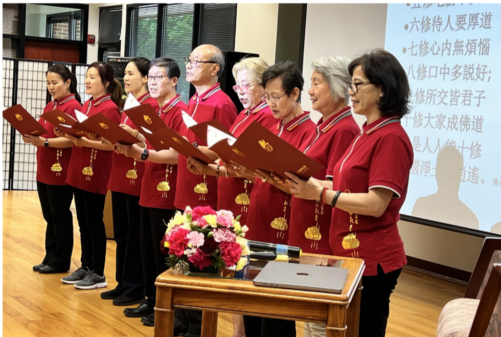
芝加哥佛光人演唱人間音緣【點燈】【十修歌】