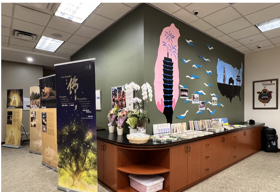
星雲大師著作書籍與大眾結緣