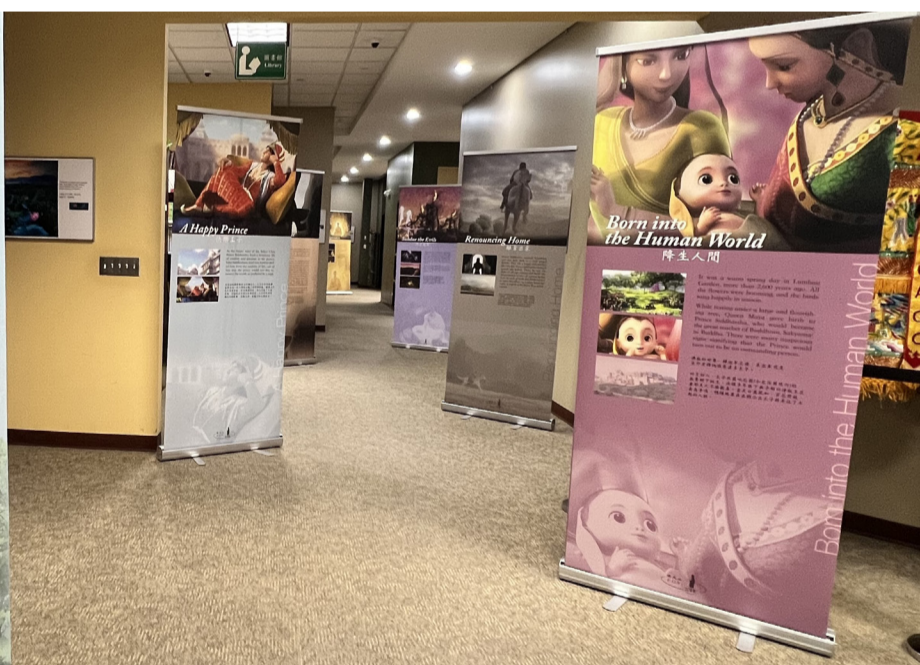
中心藝文走廊 佛陀一生特展