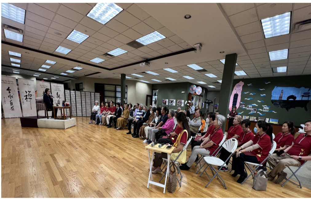
大眾全神貫注聆聽講座。心中有彼此，世界更美麗。